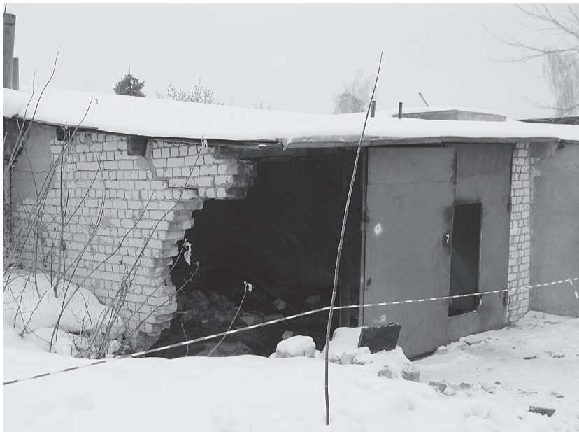
ЧП в гаражном кооперативе рядом с домом на пр. Ленина, 1В. Вот что бывает, когда объекты строят на коммуникациях.

Что касается отсутствующих разрешений на строительство кафе и шиномонтажа, то тут, возможно, закралась ошибка. И возможно, произошло это по нашей вине. В запросе в администрацию мы сформулировали вопрос именно так: на каком основании выдавалось разрешение на строительство кафе и шиномонтажа по указанным адресам? А нужно было спрашивать: на каком основании выдавались разрешения на строительство объектов, где сейчас размещаются кафе и шиномонтаж. Потому что, опять же возможно, сами пристрои были сооруже-