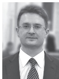
БЛОЦКИЙ Владимир Николаевич, депутат Государственной Думы РФ